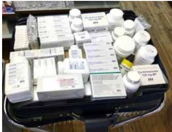
La valise pèse 21 kg.

CONTENU D'UNE VALISE REMISE. VALEUR MARCHANDE MOYENNE DE 700 $