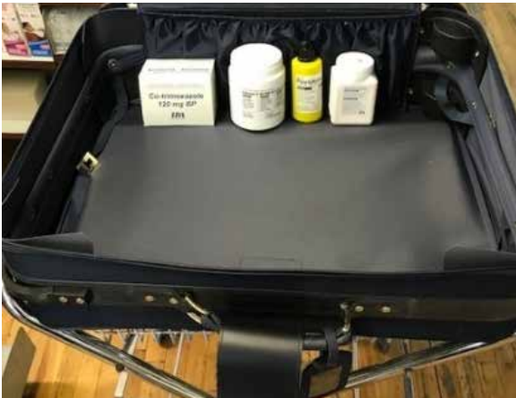
La valise pèse 0,7 kg.

VOICI LE CONTENU D'UNE VALISE SI ELLE ÉTAIT COMPARABLE À LA SEULE PARTICIPATION DEMANDÉE DE 50 $.