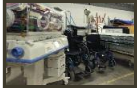
LE CONTENU DE L'AMBULANCE ENVOYÉE PAR CONTENEUR AU MALI: DU MATÉRIEL ET DES ÉQUIPEMENTS D'UNE VALEUR ESTIMÉE À 100 250 $.

Rappelons que la mission de CSI consiste à appuyer des organisations œuvrant dans les pays en développement dans la réalisation de leurs projets de développement durable dans les secteurs de la santé et de l'éducation.