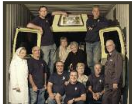
DES MEMBRES DU PERSONNEL ET DES BÉNÉVOLES DE CSI DEVANT L'AMBULANCE.

Au cours des quatre dernières années, Collaboration Santé Internationale dont le siège social est situé dans la ville de Québec, a expédié 174 conteneurs dans 30 pays en développement. Le conteneur envoyé par CSI au Mali renferme du matériel et des équipements d'une valeur estimée à 100 250 $.