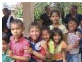
EN PAGE COUVERTURE: Guatemala